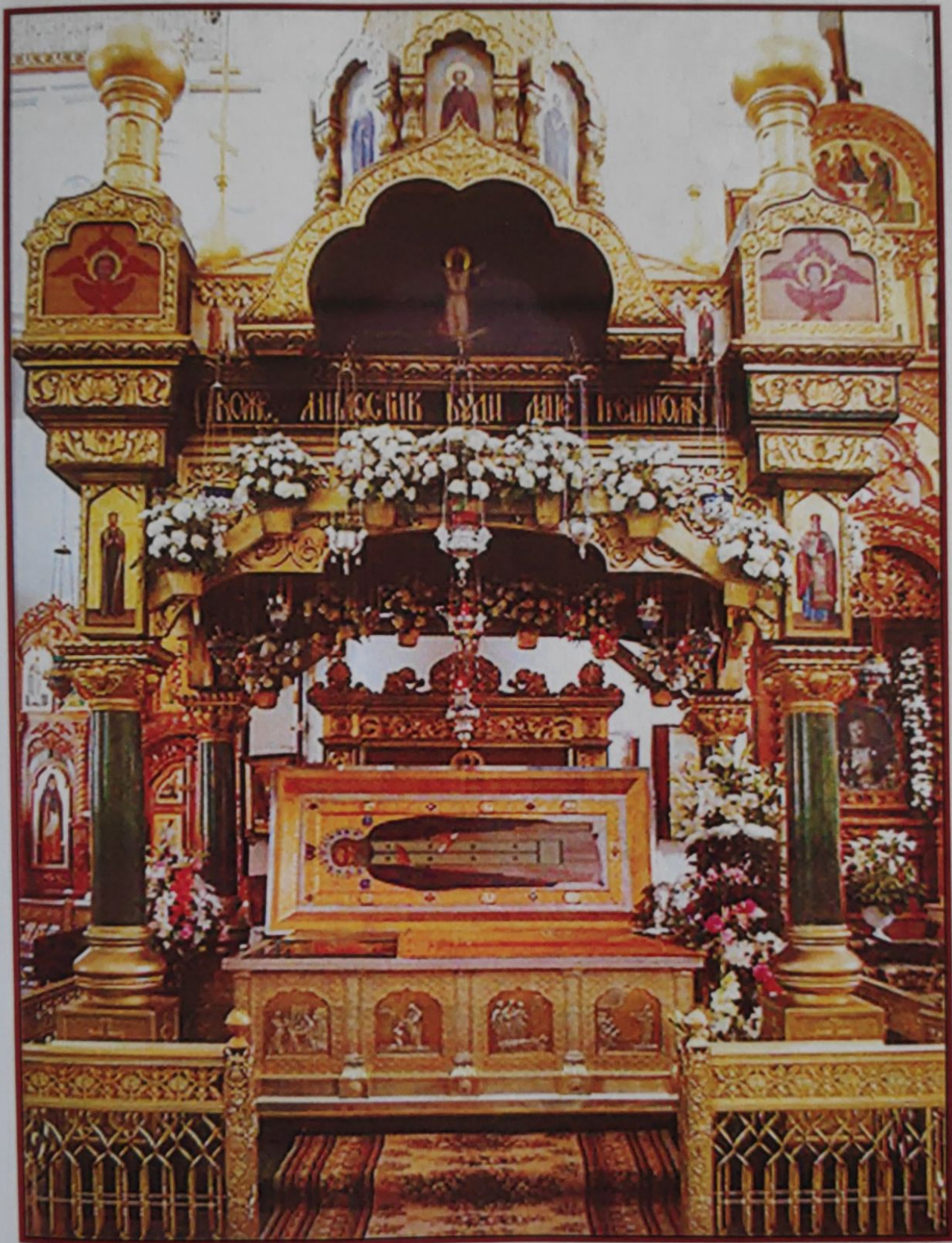
جعبه حاوی اشیای متبرکه پدر سرافیم ساروف، صومعه خواهران سرافیم - دیوویف تثلیث